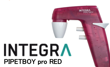
INTEGRA PIPETBOY pro RED