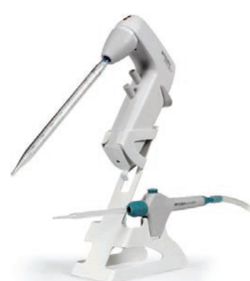
ピペットボーイ用スタンド