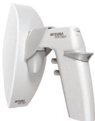
充電ステーション