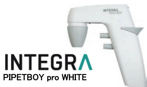
INTEGRA PIPETBOY pro WHITE