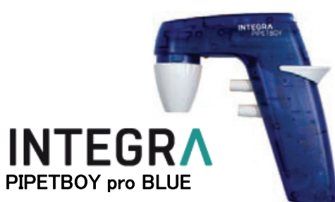
INTEGRA PIPETBOY pro BLUE